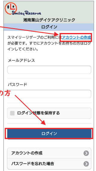
初回利用登録/ログイン画面

5月11日(月)から、一部の診療科(発熱外来と小児科診察)のご予約をWEB予約システムにより行います。患者様は、パソコン、スマートフォンから予約をして来院することができます。